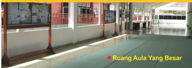
● Ruang Aula Yang Besar

Batas akhir daftar ulang dilakukan satu minggu setelah pengumuman hasil test