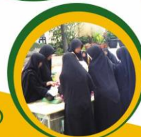
Pelatihan Pengurusan Jenazah