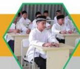
MPLS SMPIT Al-Hidayah

Pendaftaran ditutup apabila quota telah terpenuhi...!!!