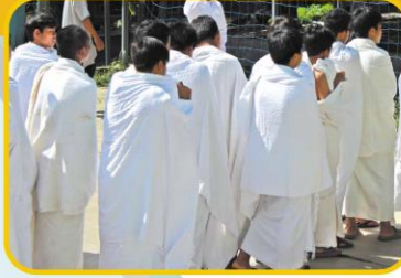
Pelatihan Manasik Haji salah satu kegiatan rutin dilakukan SMPIT Al-Hidayah Boarding School