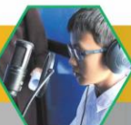
Broadcast in Radio